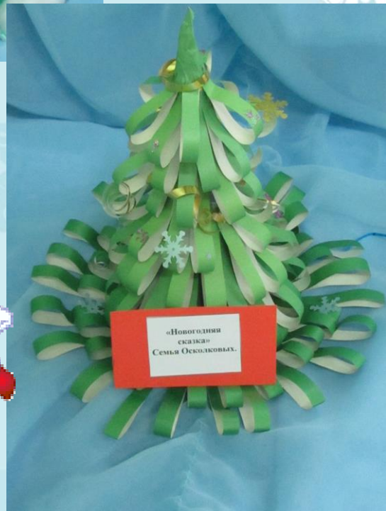
«Новогодняя сказка» Семья Озкозловых.