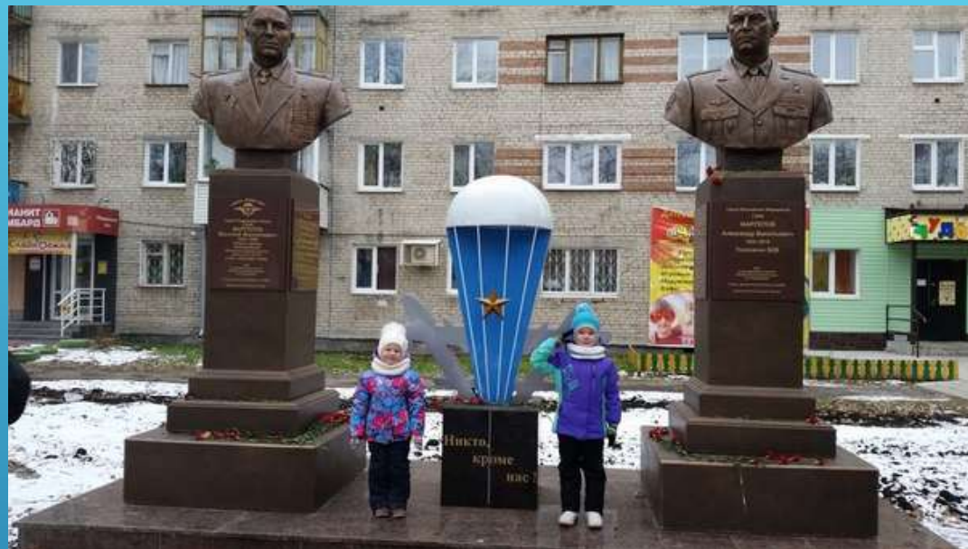
Сквер названный в честь Василия Филипповича Маргелова - Советского военачальника, командующего Воздушно- десантными войсками с 1954 до 1979 года, Героя Советского Союза.