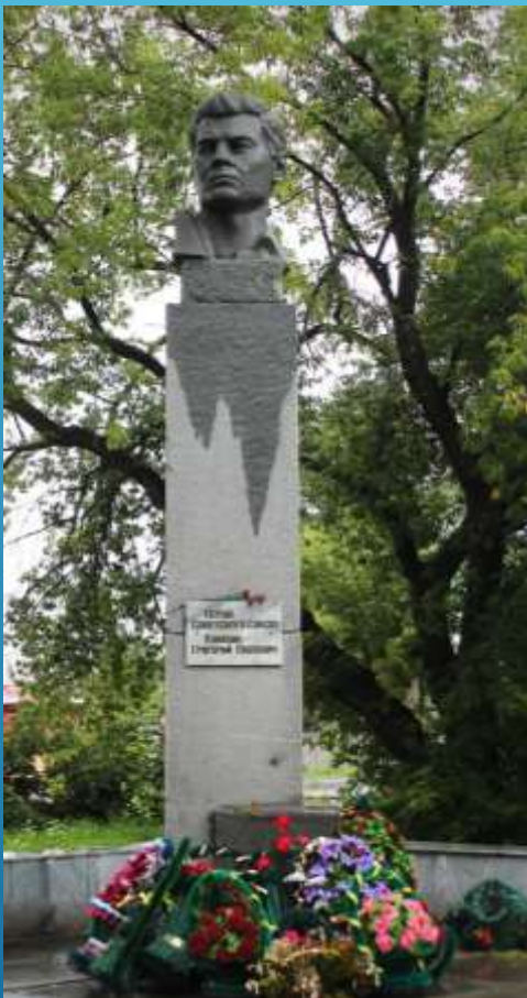
Герою Советского Союза Г.П. Кунавину