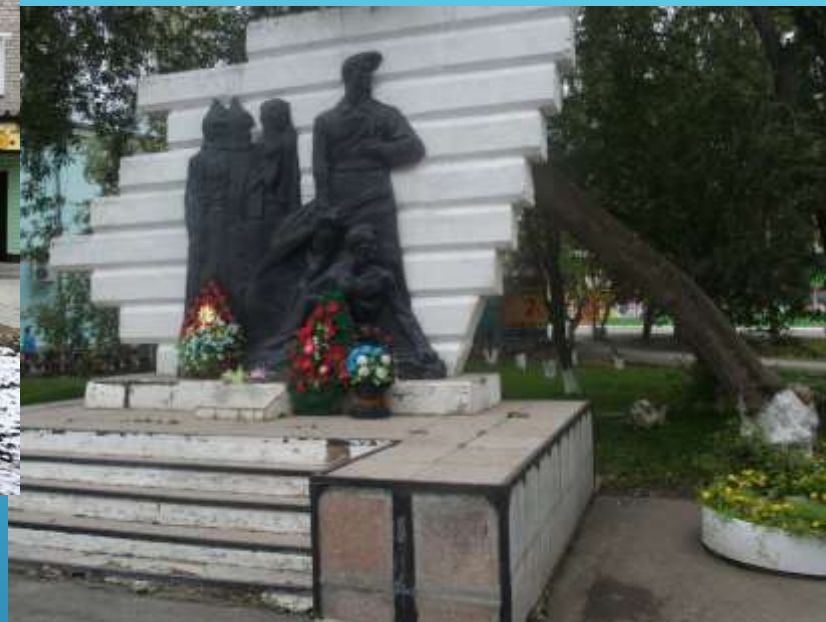
Памятник посвященный началу Великой Отечественной войны